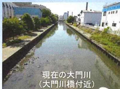
現在の大門川 (大門川橋付近)

なお、この導水は、和歌山市の「第3次和歌山市生活排水対策推進計画」において、導水することなく環境基準の達成を目指す 令和8年度末まで 実施します。