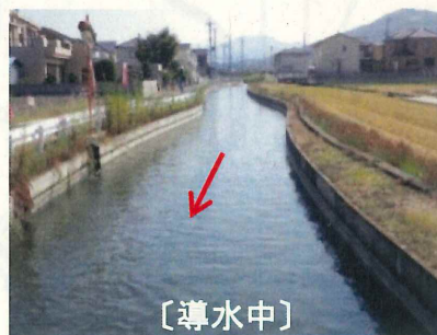
導水の状況 (小倉地区)

○事業内容に関すること 和歌山河川国道事務所 河川管理課 (TEL 073-435-0267 (平日9時～17時))